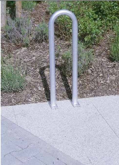
Anlehnbügel MONTANA ohne Querholm, zum Aufdübeln, in Sonderfarbe (auf Anfrage)