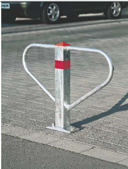
Parkbügel DENIA zum Aufdübeln