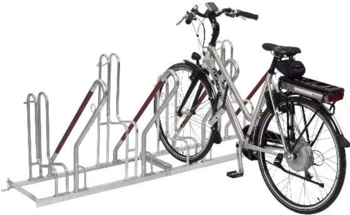
Fahrradständer OAKLAND einseitig, 4 Stellplätze, 4 Anlehnbügel, feuerverzinkt