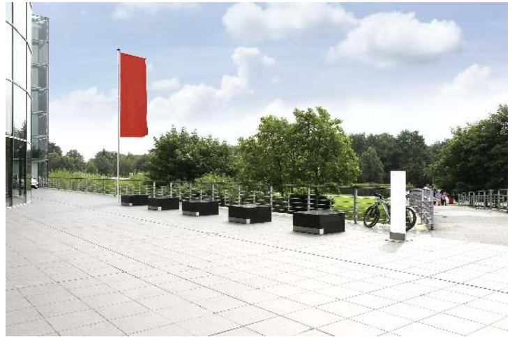
Zylindrischer Aluminium-Fahnenmast SOUTH BEND mit Teleskopausleger