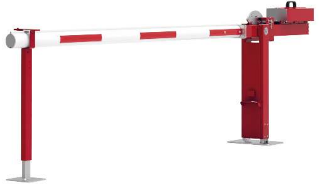
Wegesperre MOTALA NEW, zum Aufdübeln, mit fester Auflagestütze