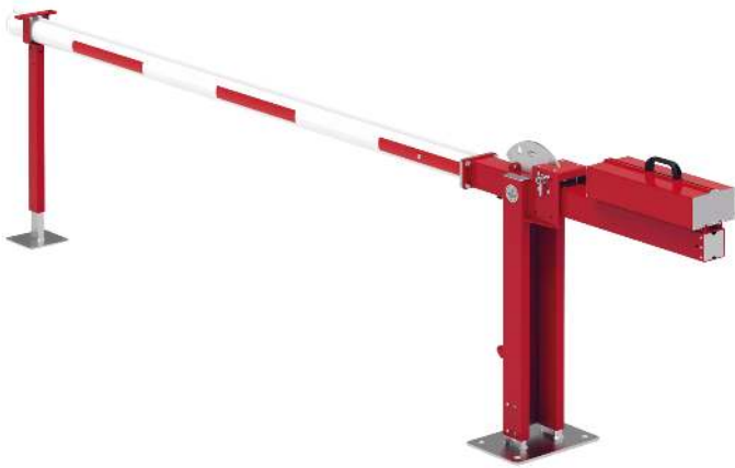
Wegesperre MOTALA NEW, zum Aufdübeln, mit fester Auflagestütze