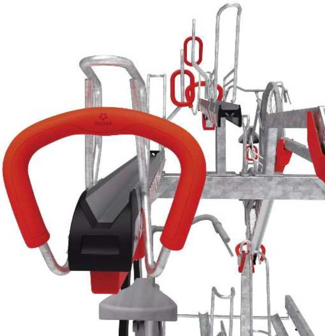
Detail: obere Einstellebene