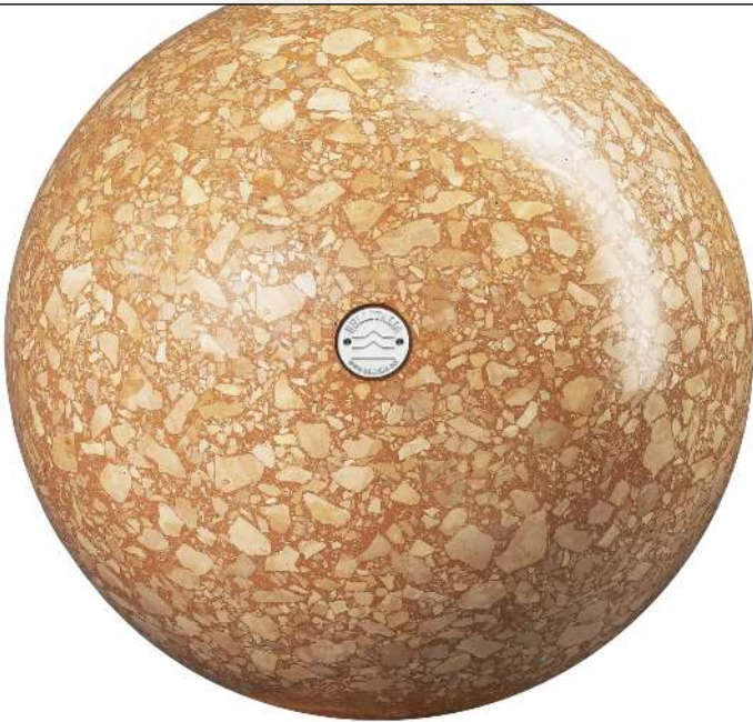
Poller SFERA aus rekonstituiertem Marmor geschliffen, in veneziano