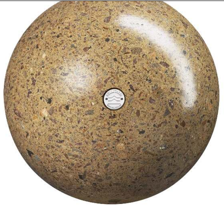
Poller SFERA aus rekonstituiertem Marmor geschliffen, in veronarat