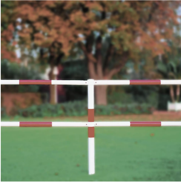
Systemgeländer URBAN, feuerverzinkt und rot-weiß lackiert