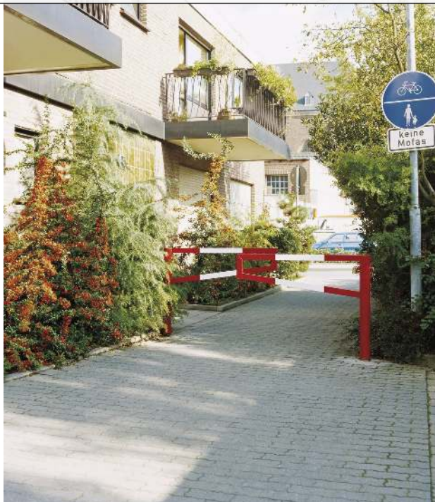
Gatterschranke AMAL - doppelseitig