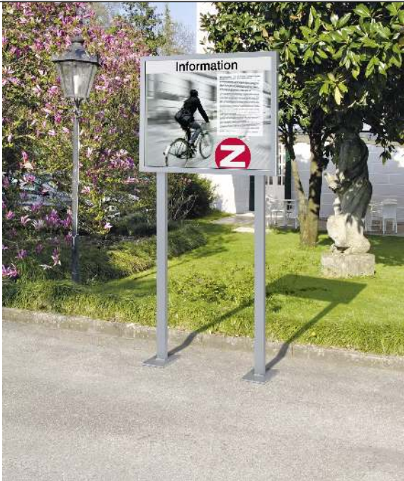
Schaukasten KALITEA mit rückseitigen Rechteckrohrständern zum Aufdübeln, in Alu silber