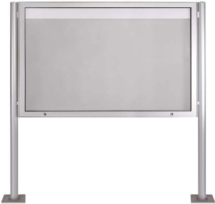
Schaukasten CITY mit Klappflügel, zum Einbetonieren, Alu in RAL 7012 basaltgrau