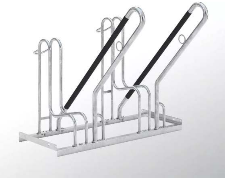
Fahrradständer IRVING, einseitig, 4 Stellplätze