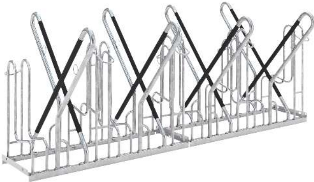
Fahrradständer IRVING, doppelseitig, 8 Stellplätze