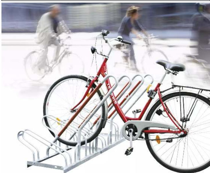
Fahrradständer NEW YORK einseitig, 4 Stellplätze, 4 Anlehnbügel