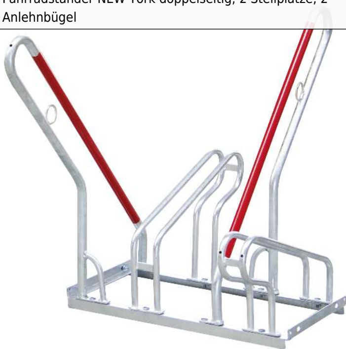
Fahrradständer NEW York doppelseitig, 2 Stellplätze, 2 Anlehnbügel