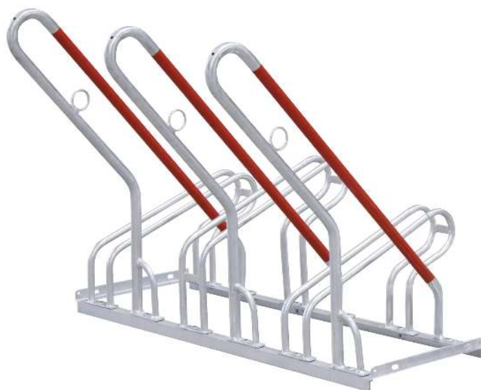
Fahrradständer NEW York einseitig, 3 Stellplätze, 3 Anlehnbügel