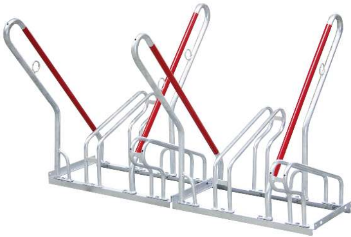
Fahrradständer NEW York doppelseitig, 4 Stellplätze, 4 Anlehnbügel