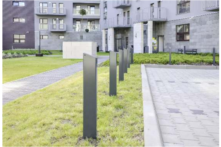
Poller BOSTON in RAL 7016 anthrazitgrau