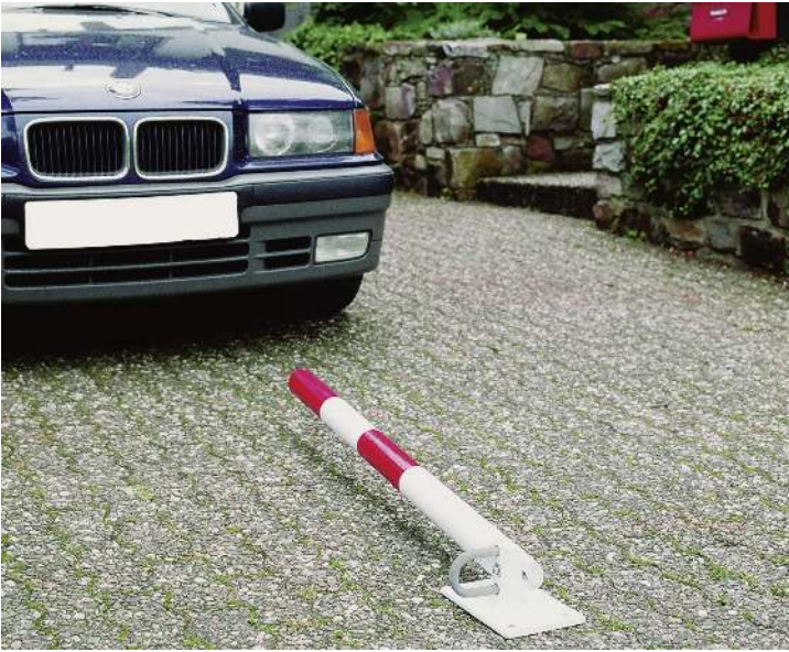
Sperrpfosten IRUN zum Aufdübeln, kippbar