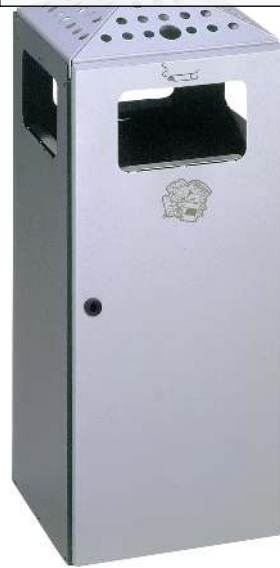
Abfallbehälter LUTON mit Ascher, aus Stahlblech, Korpus in schwarzgrau ähnlich RAL 7021, Tür und Oberteil in weißaluminium ähnlich RAL 9006