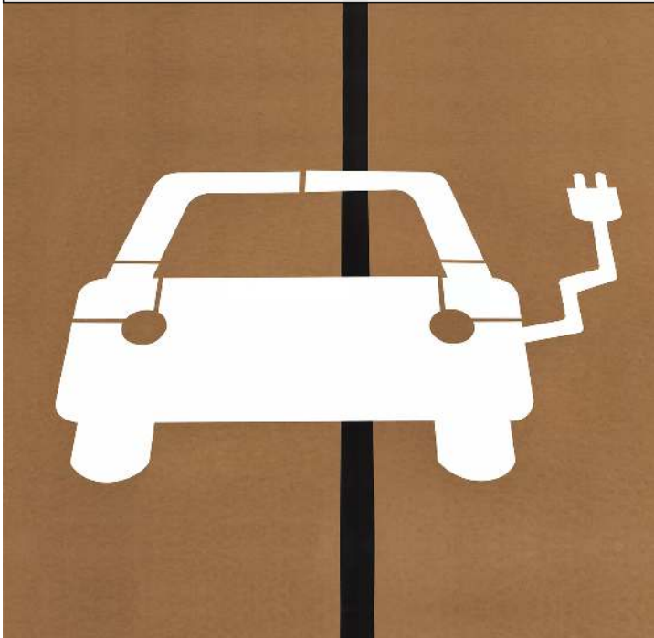
Bodenschablone E-Parkplatz AVAJAN