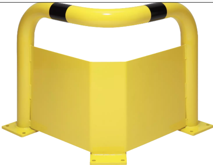
Rammschutzwinkel KEURU mit Unterfahrerschutz für den Innenbereich, zum Aufdübeln, Höhe 600 mm, gelb kunststoffbeschichtet mit schwarzen Signalstreifen