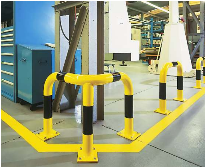
Rammschutzwinkel KEURU, gelb kunststoffbeschichtet mit schwarzen Signalstreifen