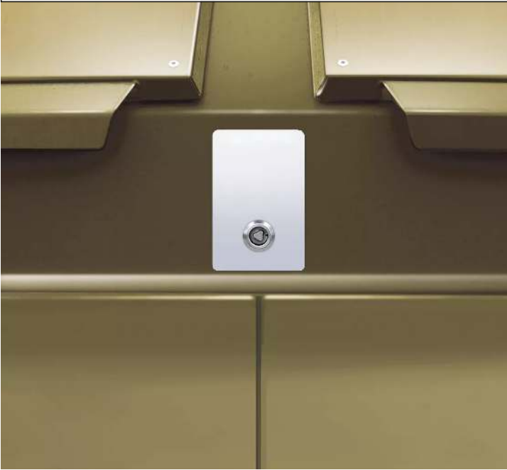
Detail: zentrale Schließung der Entnahmetür mittels Dreikant-Mittelverschluss aus Edelstahl