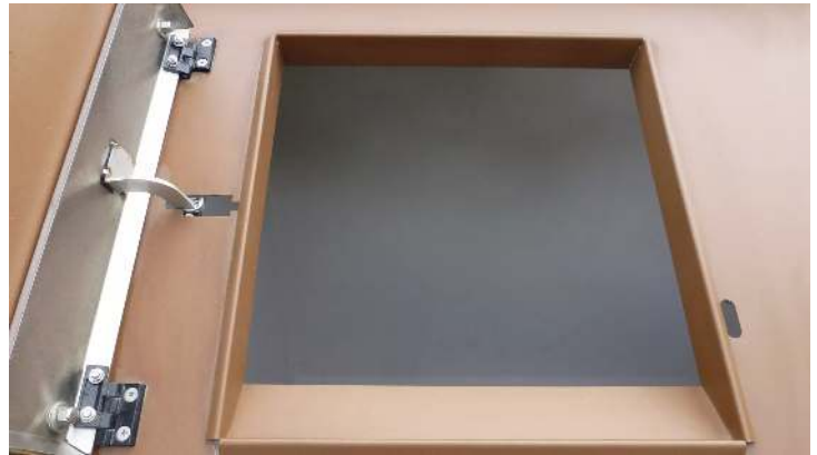
Detail: Schüttkanal für 2-Rad-Abfallgroßbehälter (Mehrpreis)