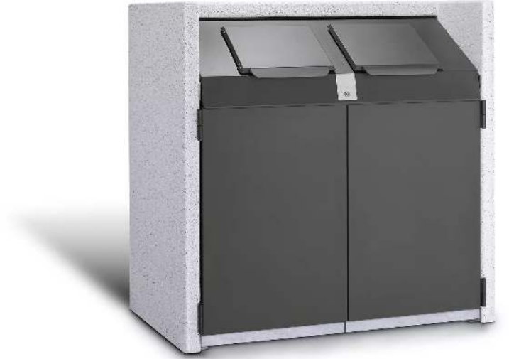
Containerbox SWANLEY, Korpus Sichtbeton feingestockt in procarat® mixed, Stahlteile in RAL 7016 anthrazitgrau