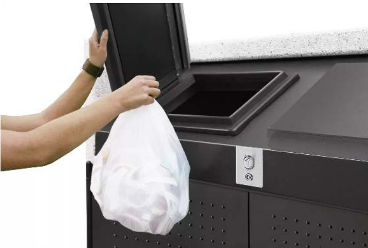
Detail: Einhandbedienbarkeit (Standard), so haben Sie immer eine Hand zum Einwerfen frei