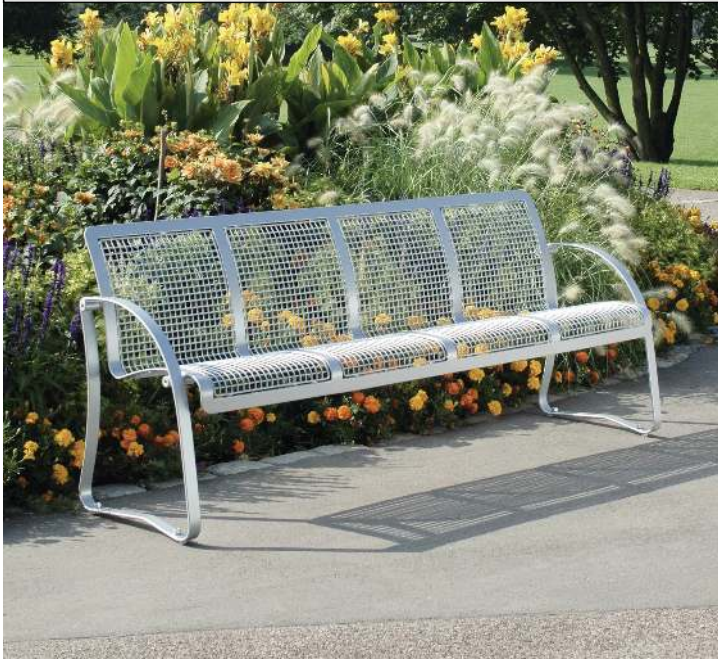
Sitzbank MODICA, Breite 1970 mm, zum Aufdübeln, in RAL 9006 weißaluminium