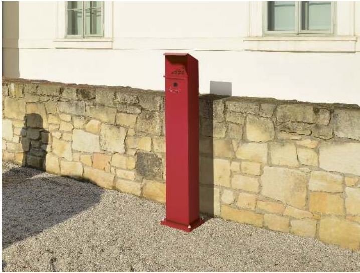
Standascher WINDSOR in RAL 3000 feuerrot