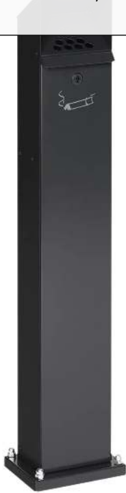
Standascher WINDSOR aus Stahl, in RAL 7021 schwarzgrau