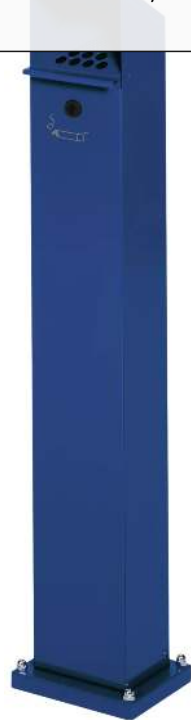
Standascher WINDSOR aus Stahl, in RAL 5010 enzianblau