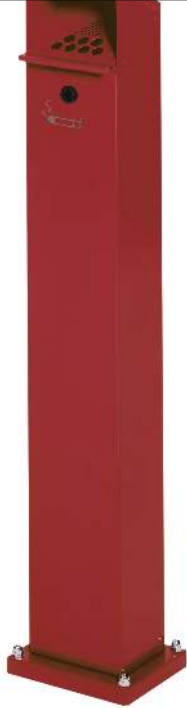
Standascher WINDSOR aus Stahl, in RAL 3000 feuerrot