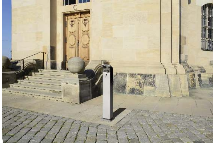
Standascher WINDSOR aus Edelstahl