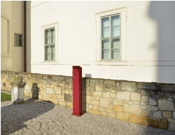
Standascher WINDSOR aus Stahl, in RAL 3000 feuerrot