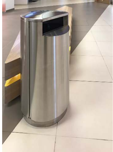
Standbehälter FINBIN CITY aus Edelstahl, 75 Liter, ohne Ascher, zum freien Aufstellen mittels betonbeschwertem Edelstahlsockel (auf Anfrage)