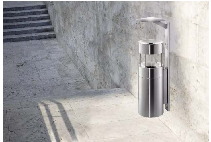
Abfallbehälter QUEEN mit Ascher, zur Wandbefestigung, Abfallbehälter mit Löschaufsatz, Ascher mit Trichter