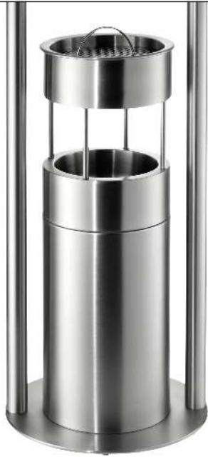
Abfallbehälter QUEEN mit Ascher, zum Aufdübeln, Abfallbehälter mit Aufsatzring, Ascher mit Sieb