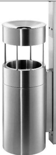
Abfallbehälter QUEEN mit Ascher, zur Wandbefestigung, Abfallbehälter mit Aufsatzring, Ascher mit Trichter