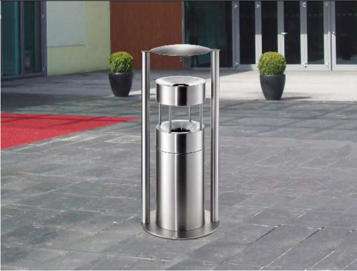
Abfallbehälter QUEEN mit Ascher, zum Aufdübeln, Abfallbehälter mit Löschaufsatz, Ascher mit Trichter