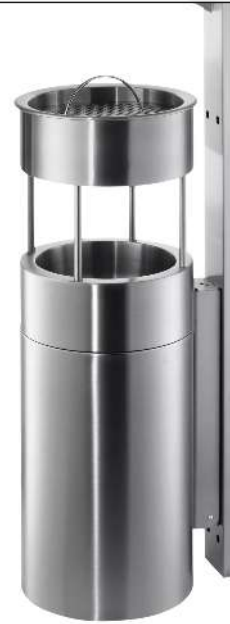
Abfallbehälter QUEEN mit Ascher, zur Wandbefestigung, Abfallbehälter mit Aufsatzring, Ascher mit Sieb