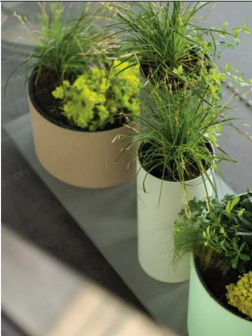
Detail: zylindrische Behälter in RAL 1019 graubeige, RAL 1013 perlweiß und RAL 6019 weißgrün