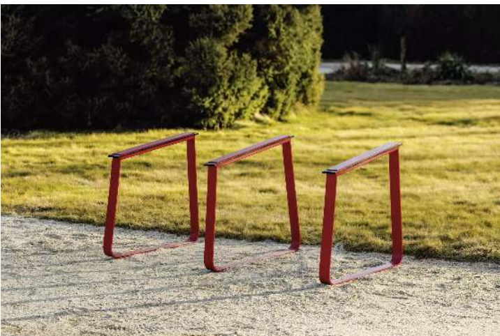
Anlehnbügel IGLAU, Breite 833 mm, in RAL 3020 verkehrsrot