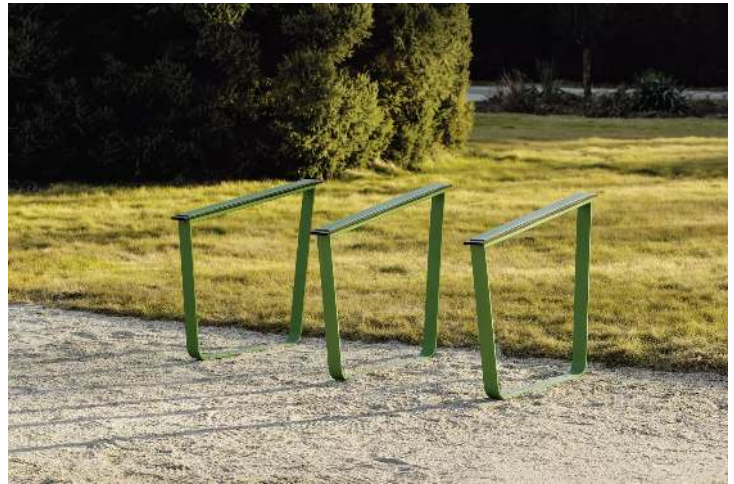
Anlehnbügel IGLAU, Breite 900 mm, in RAL 6010 grasgrün