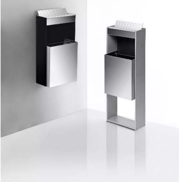
Abfallbehälter MOROKA mit Ascher, 17 Liter, zur Wandbefestigung Abfallbehälter MOROKA mit Ascher, 19 Liter, zum Aufdübeln