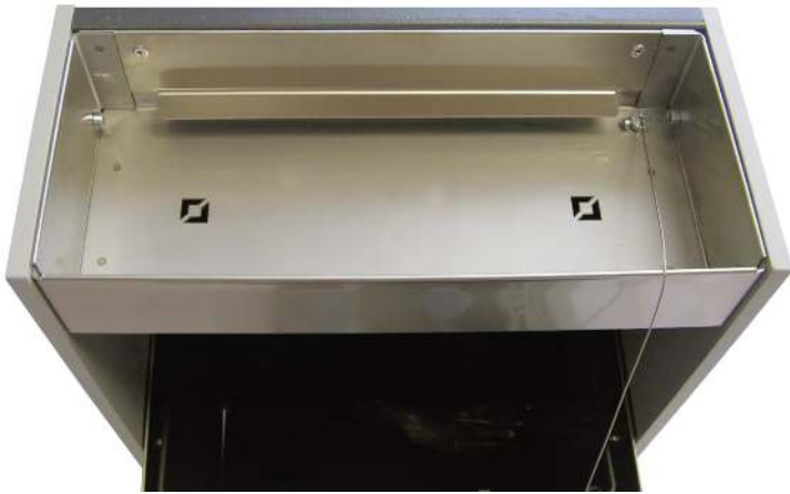
Draufsicht ohne Ascher