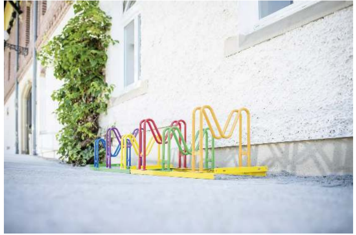
Kinderfahrradständer MARYLAND, 6 Stellplätze, pulverbeschichtet