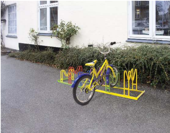
Kinderfahrradständer MARYLAND, farbig beschichtet, 6 Stellplätze