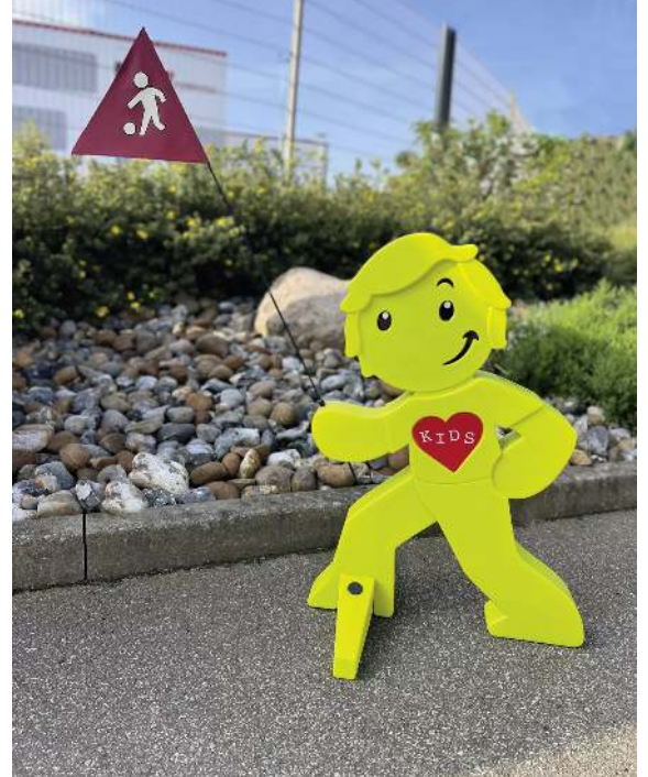
Warnfigur MARLOW in grün