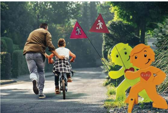
Warnfigur MARLOW in orange und grün