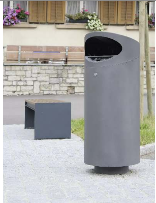
Abfallbehälter TOLUCA mit Ascher, in RAL 7016 anthrazitgrau