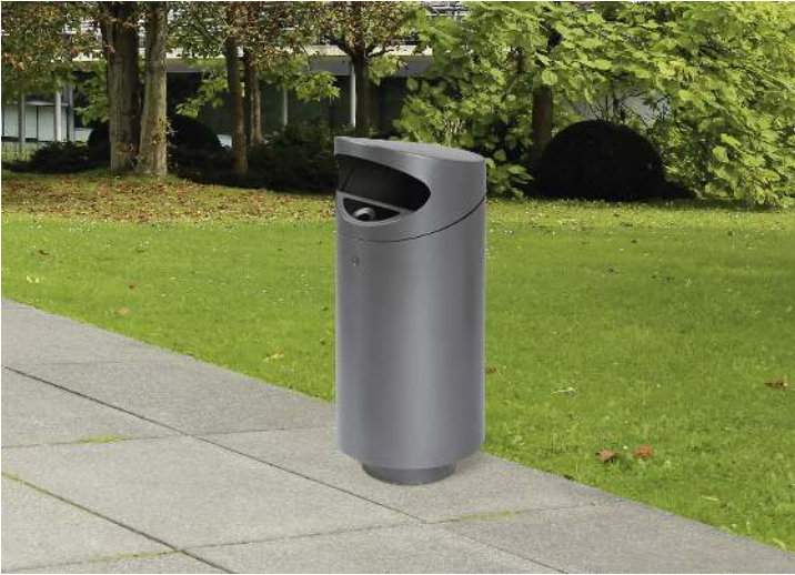
Abfallbehälter TOLUCA mit Ascher, zum Aufdübeln, in RAL 7016 anthrazitgrau