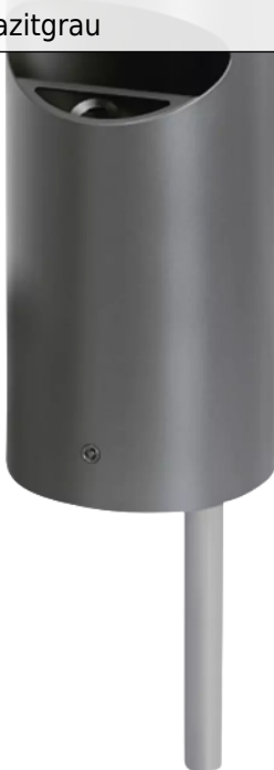
Abfallbehälter TOLUCA mit Ascher, Pfostenbefestigung, in RAL 7016 anthrazitgrau