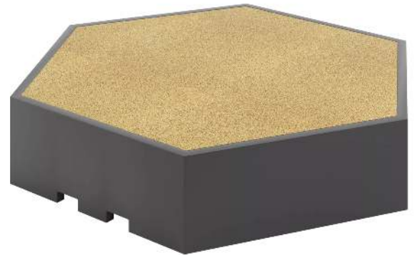
Podest für Stadtterrasse RelaxDEX, Höhe 550 mm