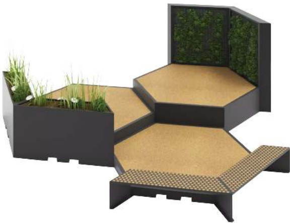
Stadtterrasse RelaxDEX mit 3 Podesten, 150 mm, 350 mm und 550 mm Höhe, je 2 Pflanzbehälter, -wände und Sitzbänke, Bodenbelag aus drainagefähigem Kork