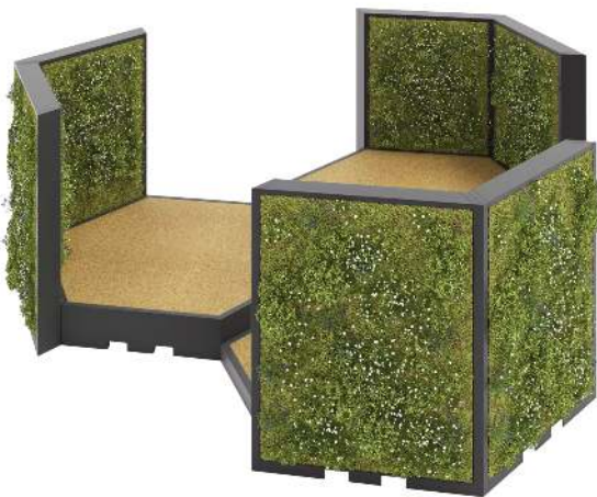
Stadtterrasse RelaxDEX mit 3 Podesten, 150 mm, 350 mm und 550 mm Höhe, je 2 Pflanzwände, Bodenbelag aus drainagefähigem Kork