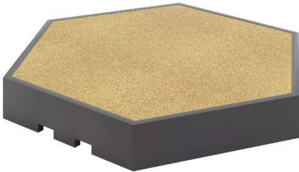
Podest für Stadtterrasse RelaxDEX, Höhe 350 mm