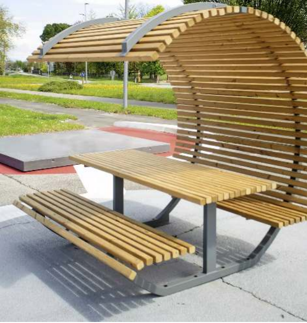
Freizeitüberdachung CISON CONTEA mit Tisch und Sitzbänken, halbkreisförmig, mit Kiefernholzbelattung, Stahlteile in RAL 7012 basaltgrau