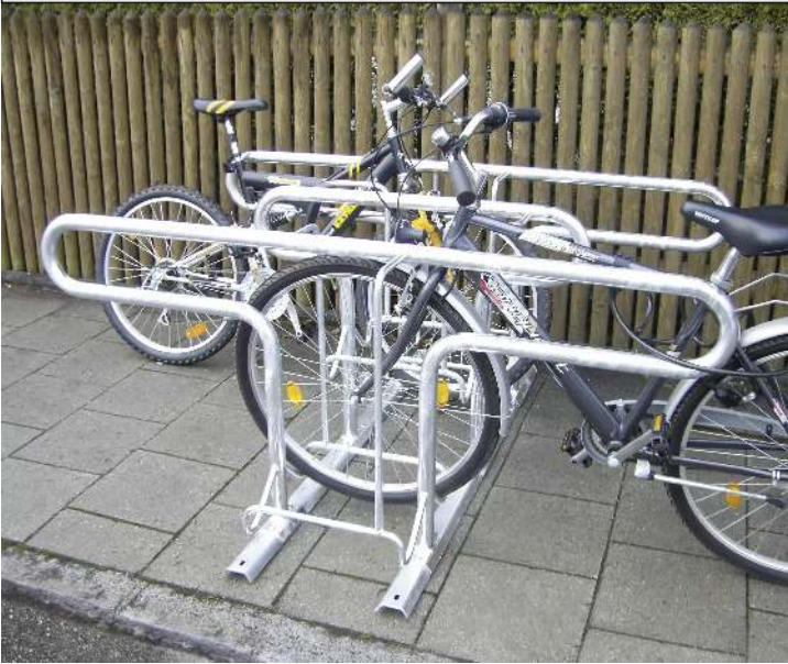
Reihenparker HEDLAND doppelseitig, hoch / tief, zum Aufdübeln bei +/- 0 mm