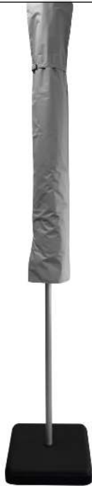
Mittelmastschirm SCILLA, inkl. Schutzhülle