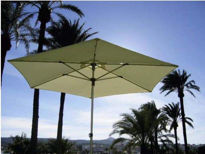
Mittelmastschirm SCILLA, Schirmtuch in Bitter Orange</div>