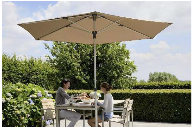
Mittelmastschirm SCILLA, Schirmtuch in White Sand</div>