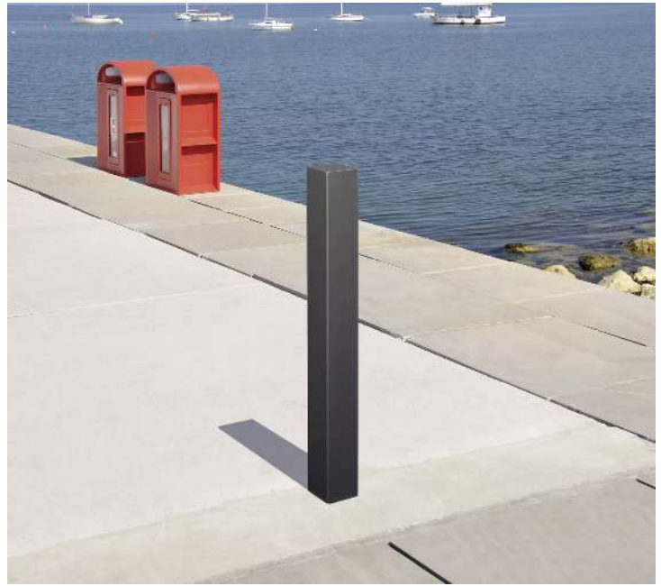
Poller PALENCIA in RAL 7016 anthrazitgrau