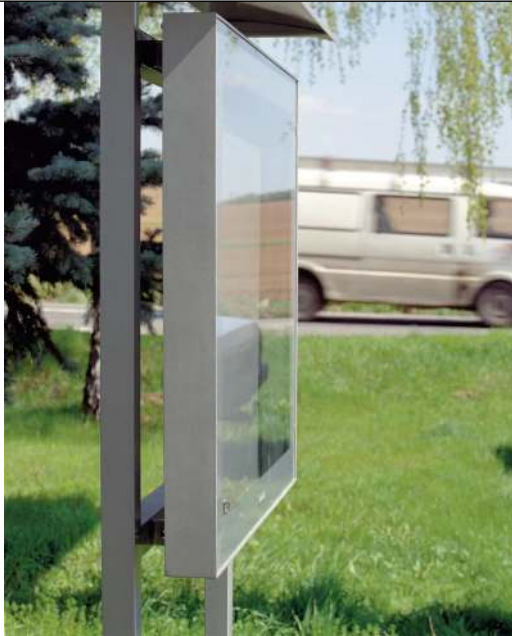
Schaukasten C-LIGHT IF mit Quadratrohrständern zum Aufdübeln und Überdachung, in RAL 9007 graualuminium