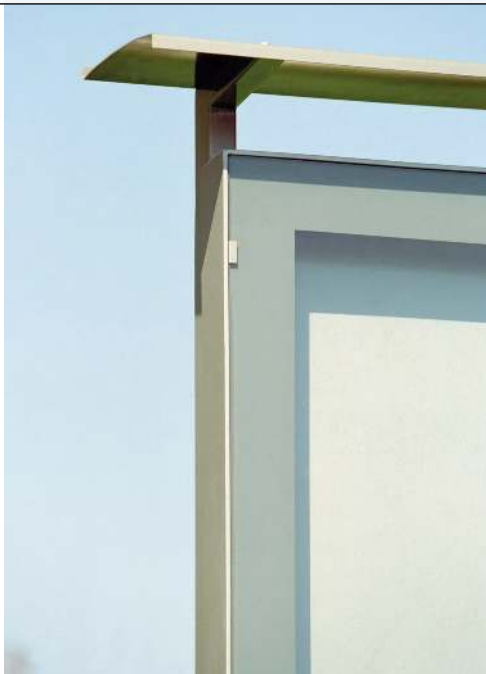
Überdachung Schaukasten C-LIGHT IF in RAL 9007 grualuminium