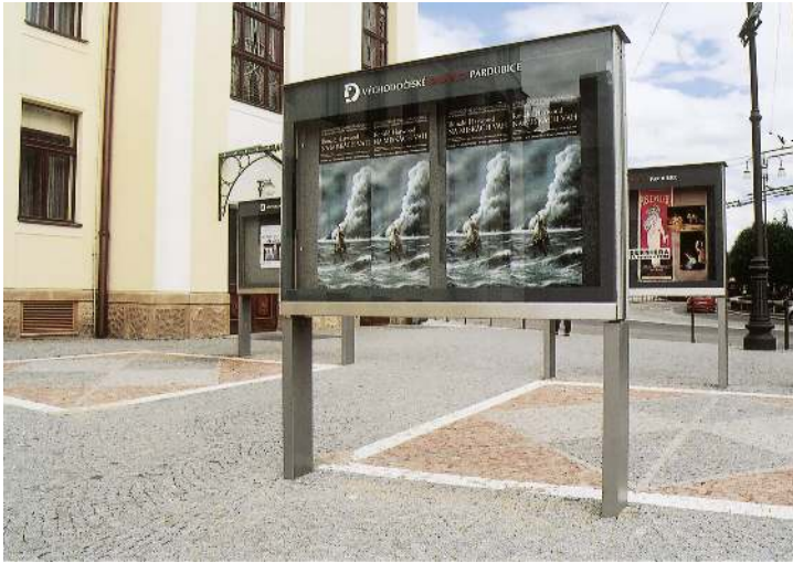
Schaukasten C-LIGHT IF mit Rechteckrohrständern zum Aufdübeln, doppelseitig, in RAL 9007 grau aluminium