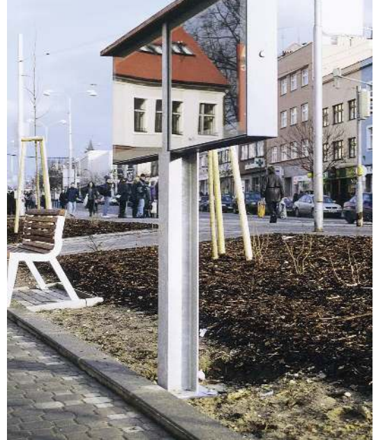
Schaukasten C-LIGHT IF mit zentralem Grundständer zum Aufdübeln und Überdachung, in RAL 9006 weißaluminium