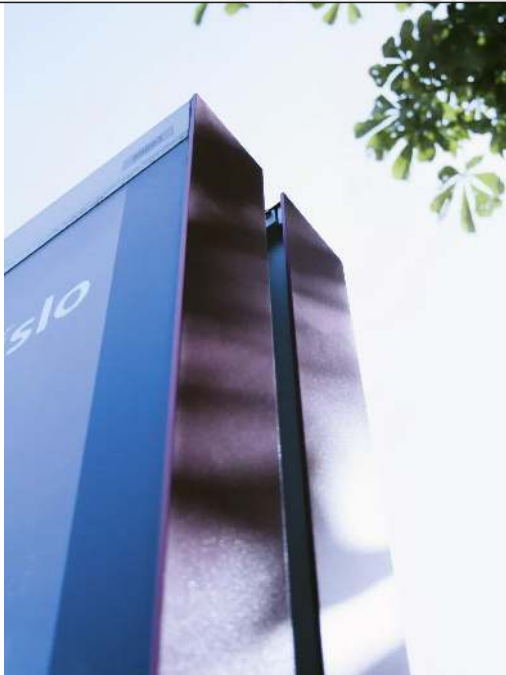
Schaukasten C-LIGHT IF, doppelseitig, in RAL 9007 grualuminium