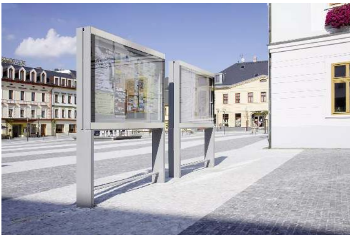
Schaukasten C-LIGHT IF mit Rechteckrohrständern zum Aufdübeln, doppelseitig, in RAL 9006 weißaluminium