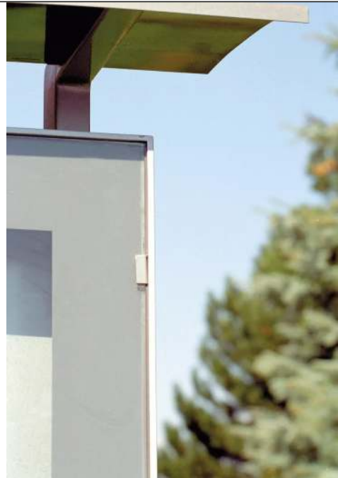
Überdachung Schaukasten C-LIGHT IF in RAL 9007 graualuminium