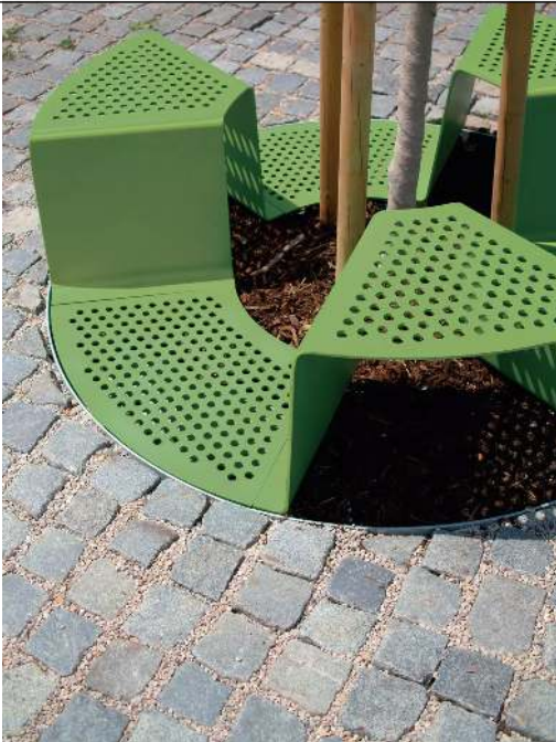
Baumschutzrost SINUS mit 3 Sitzen, Sitz ohne Kunststoffnoppen, in RAL 6010 grasgrün