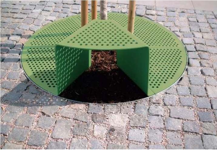
Baumschutzrost SINUS mit 1 Sitz, Sitz ohne Kunststoffnoppen, in RAL 6010 grasgrün