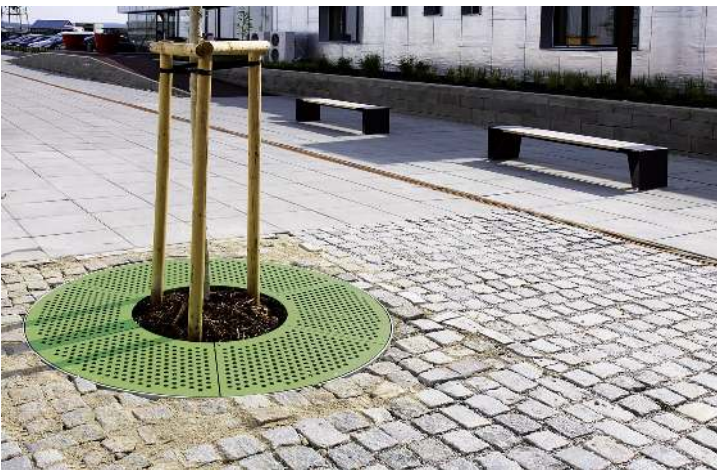
Baumschutzrost SINUS mit 3 Sitzen, Sitze ohne Kunststoffnoppen, in RAL 6010 grasgrün