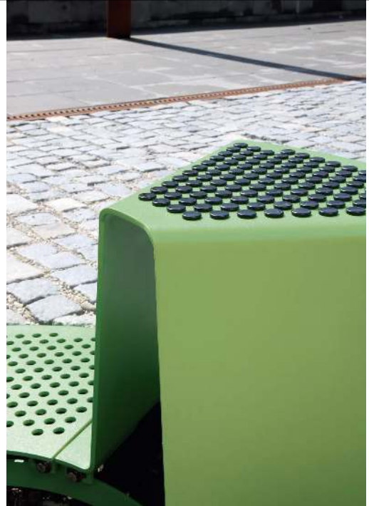
Detail: Sitz mit Kunststoffnoppen