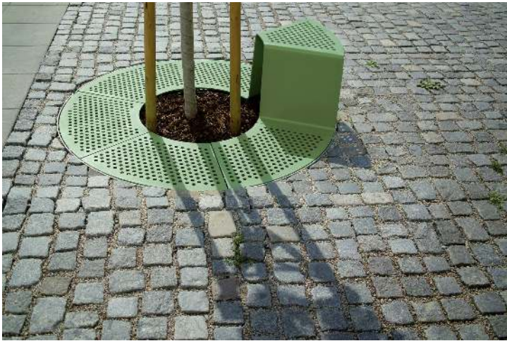
Baumschutzrost SINUS mit 1 Sitz, Sitz ohne Kunststoffnoppen, in RAL 6010 grasgrün