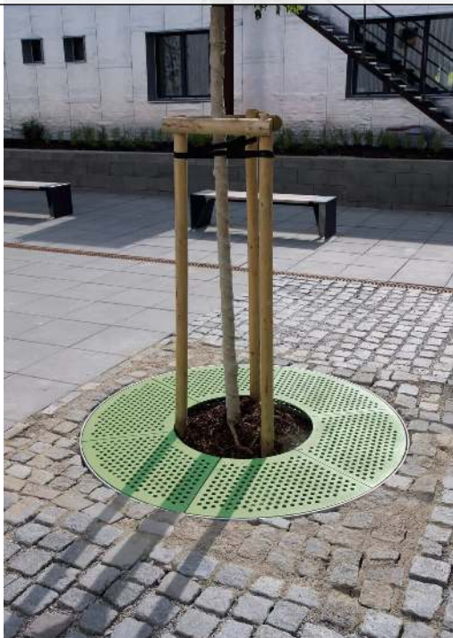
Baumschutzrost SINUS in RAL 6010 grasgrün