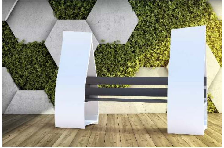
Sitzbank VINGAR mit Rückenlehne