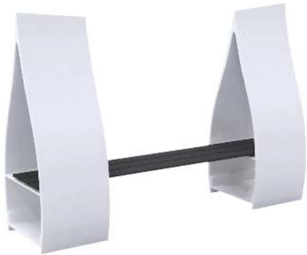
Sitzbank VINGAR ohne Rückenlehne