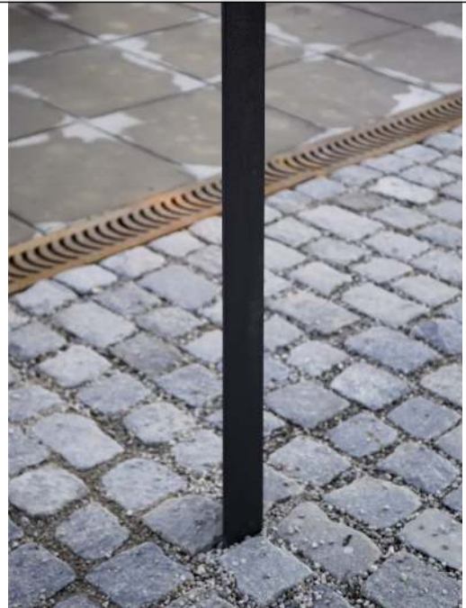
Poller LOT zum Aufdübeln bei -100 mm, in RAL 7016 anthrazitgrau