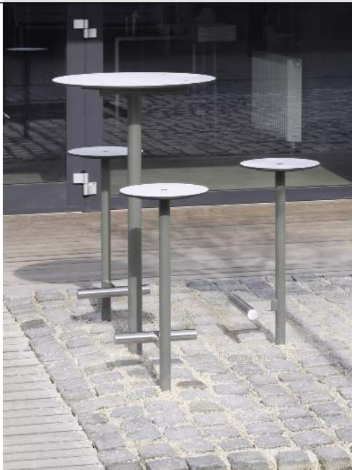
3 Barhocker und Stehtisch BISTROT mit HPL-Auflage in White 0085, Stahlteile in RAL 9007 graualuminium