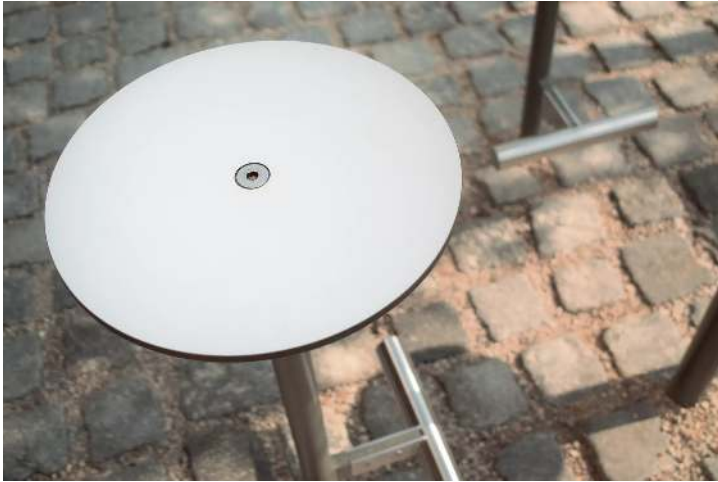
Detail: HPL-Auflage in White 0085