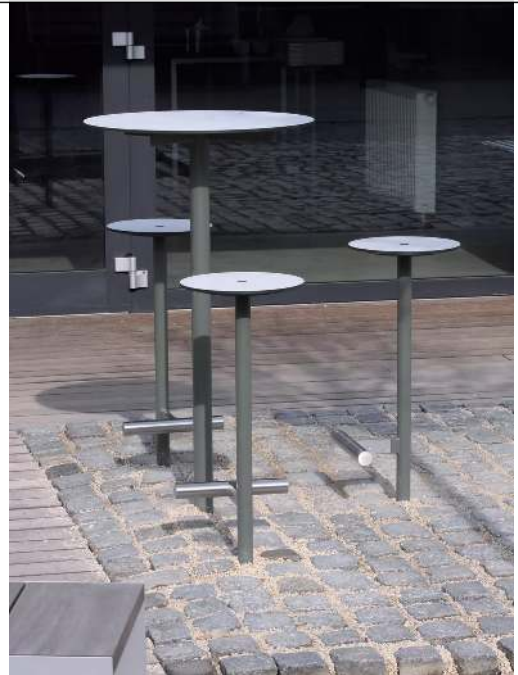
Stehtisch BISTROT mit HPL-Auflage in Black 0080, Stahlteile in DB 703 eisenglimmer