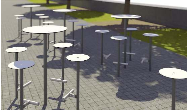
Stehtisch BISTROT mit HPL-Auflage in Black 0080, Stahlteile in DB 703 eisenglimmer