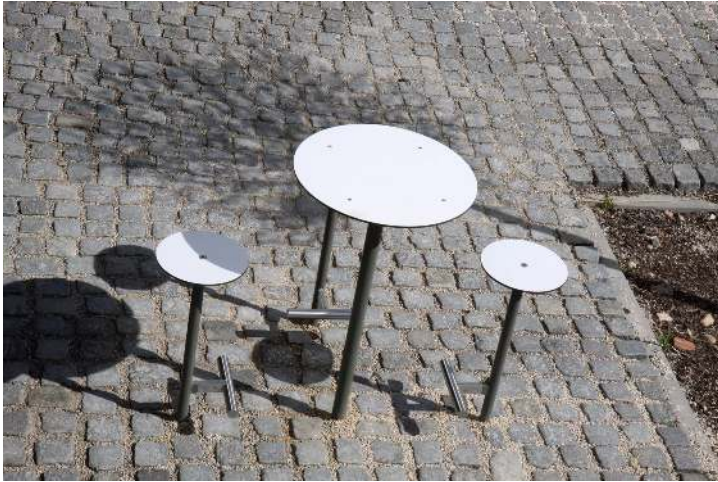
Barhocker und Stehtisch BISTROT mit HPL-Auflage in White 0085, Stahlteile in RAL 9007 graualuminium