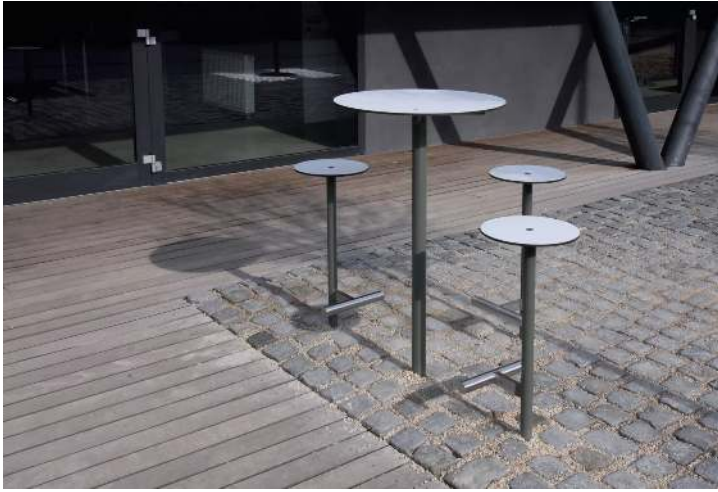
Barhocker und Stehtisch BISTROT mit HPL-Auflage in White 0085, Stahlteile in RAL 9007 graualuminium