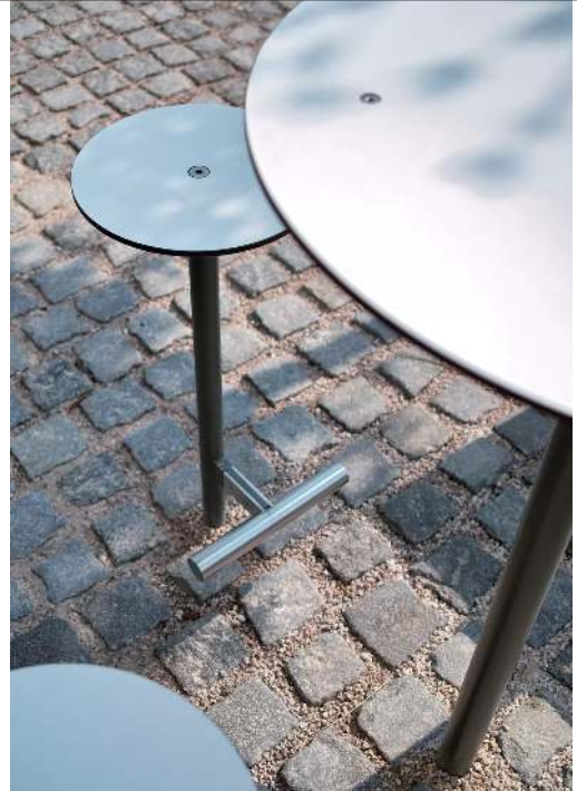
Detail: HPL-Auflage in White 0085