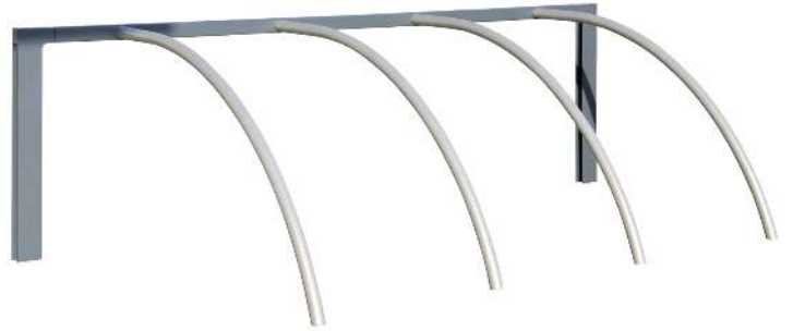
Anlehnbügel UNIT, 4 Stellplätze, Stützen in RAL 7016 anthrazitgrau und Bügel in RAL 9006 weißaluminium