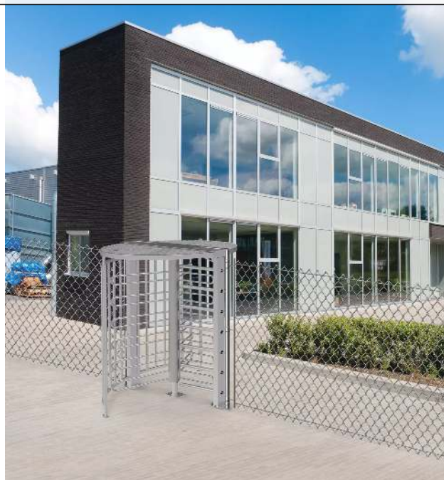
Drehkreuz LARDOS, zum Aufdübeln, ohne Bodenrahmen, mit Übersteigenschutz, feuerverzinkt