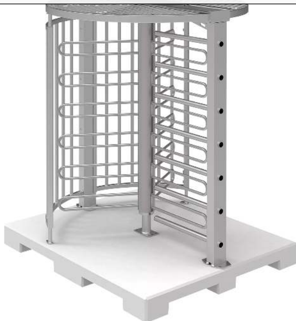
Drehkreuz LARDOS, zum Aufdübeln, mit fertigem Betonfundament, mit Übersteigenschutz, feuerverzinkt