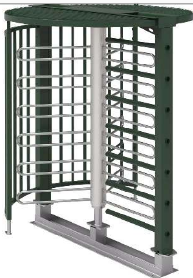
Drehkreuz LARDOS, zum Aufdübeln, mit Bodenrahmen, mit Übersteigenschutz, in RAL 6005 moosgrün