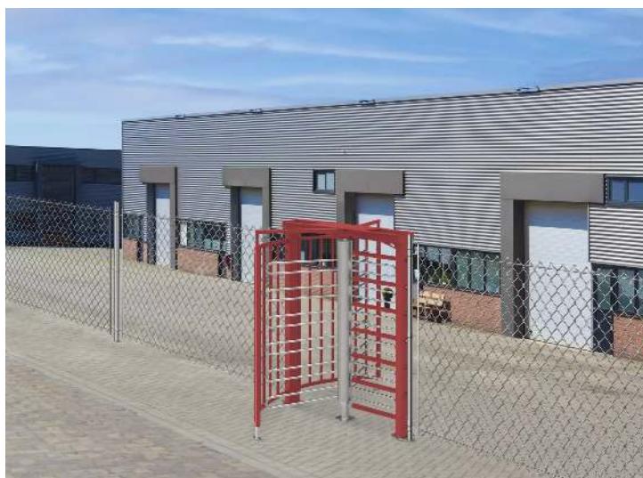
Drehkreuz LARDOS, zum Aufdübeln, ohne Bodenrahmen, ohne Übersteigenschutz, in RAL 3020 verkehrsrot