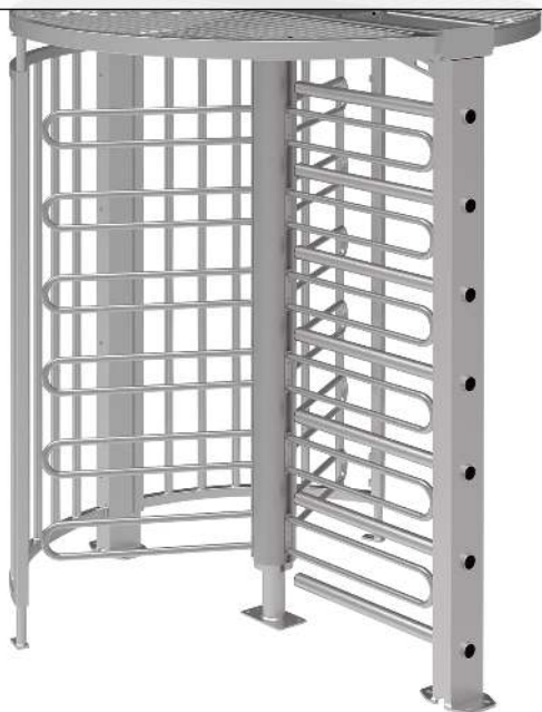
Drehkreuz LARDOS, zum Aufdübeln, ohne Bodenrahmen, mit Übersteigenschutz, feuerverzinkt