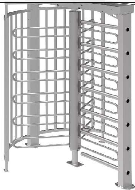
Drehkreuz LARDOS, zum Aufdübeln, ohne Bodenrahmen, ohne Übersteigenschutz, feuerverzinkt