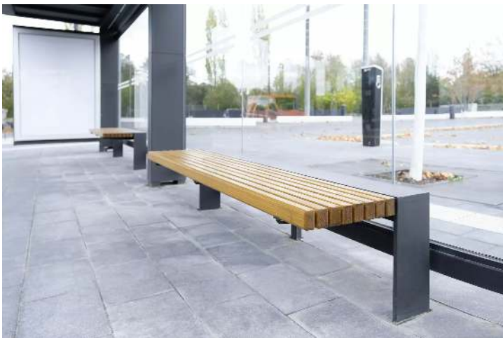
Sitzbank PURE, 3-Sitzer mit Holzauflage, Stahlkonstruktion in DB 703 eisenglimmer