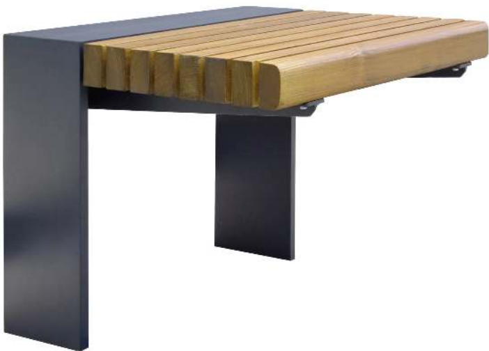
Sitzbank PURE, 1-Sitzer