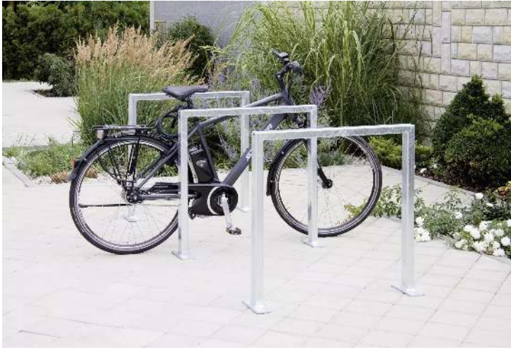
Anlehnbügel FLINT zum Aufdübeln, feuerverzinkt