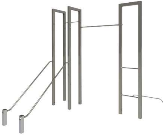
Calisthenics-Anlage XS-FELD, Ausführung Push Up, Serie BARFORZ