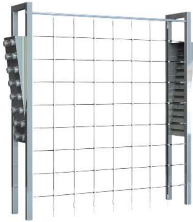
Calisthenics-Station CLIMBING WALL VARIO