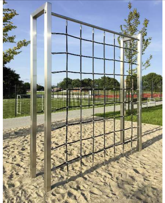
Calisthenics-Station CLIMBING WALL