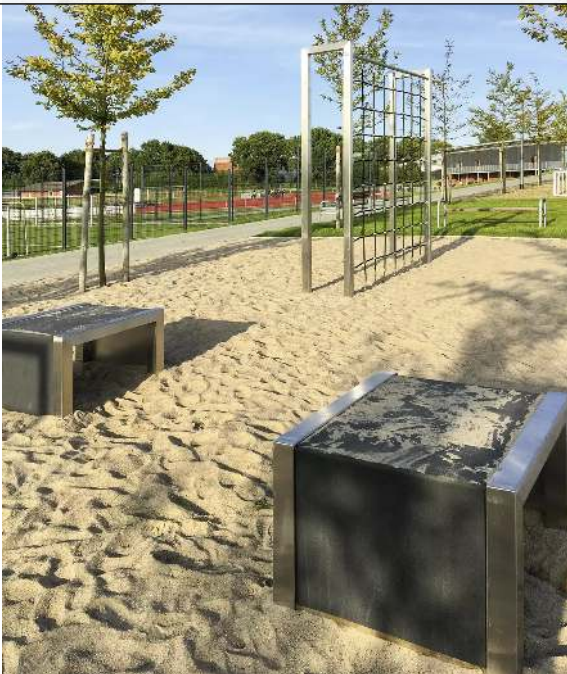
Calisthenics-Station CLIMBING WALL und Calisthenics-Station JUMPING BOX