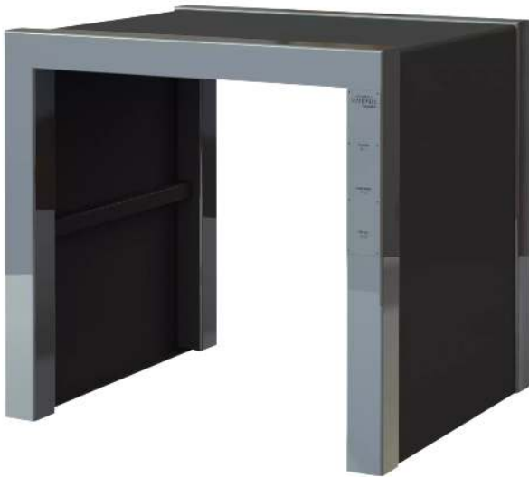
Calisthenics-Station JUMPING BOX, Höhe 840 mm