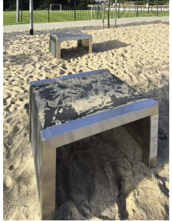
Calisthenics-Station JUMPING BOX, Höhe 540 mm