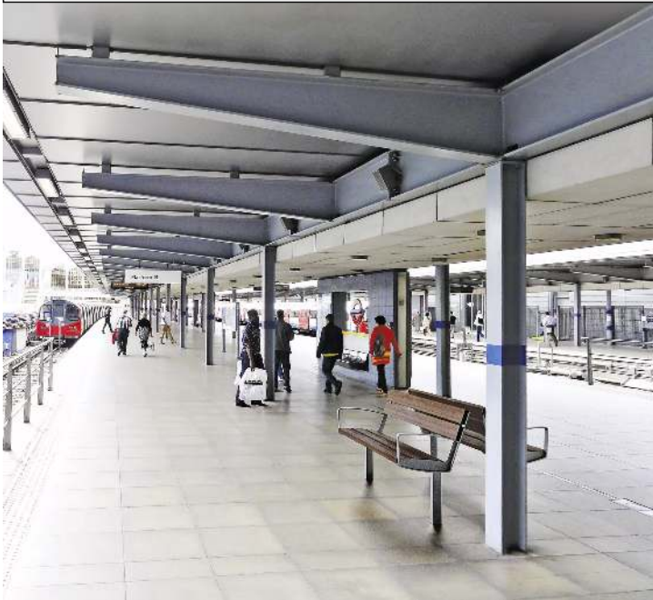
Sitzbank INTERVERA mit Jatobaholzbelattung, Stahlteile in DB 703 eisenglimmer