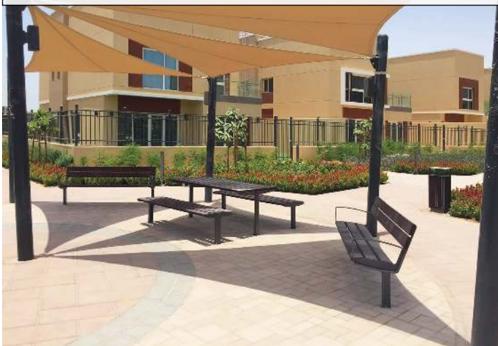
Sitzbank INTERVERA, Sitzbank VERA SOLO, Tisch VERA SOLO und Abfallbehälter DIAGONAL, mit Resysta®-Belattung lasiert in siam, Stahlteile in 7016 anthrazitgrau