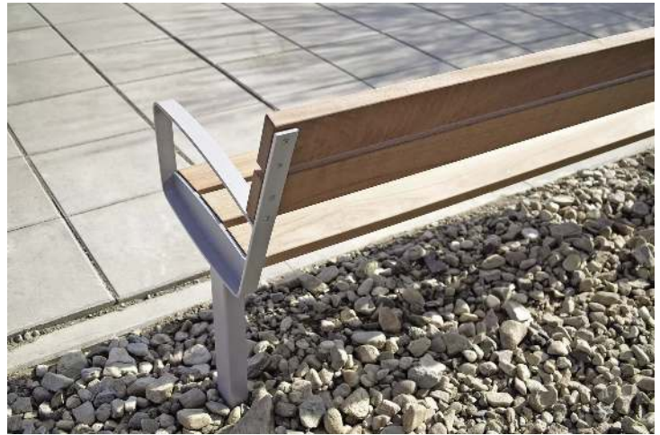
Sitzbank INTERVERA mit Jatobaholzbelattung, Stahlteile in RAL 9007 graualuminium