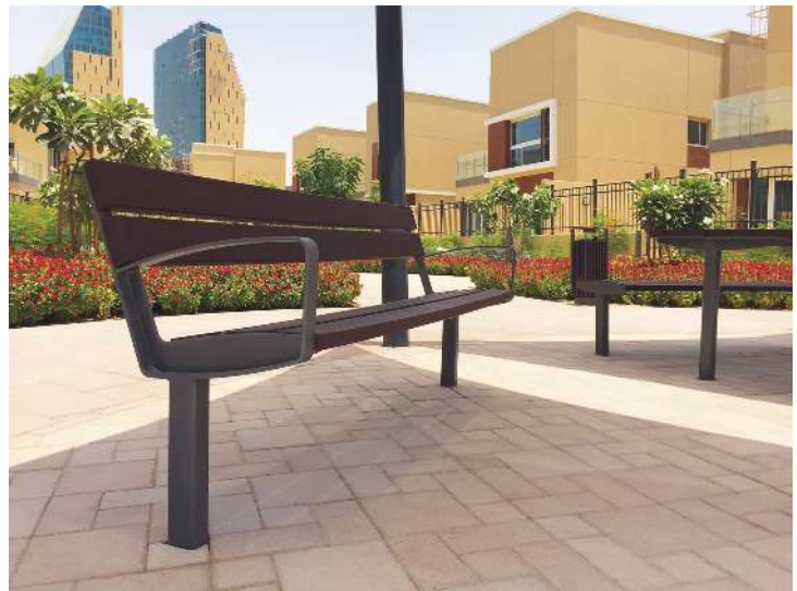
Sitzbank INTERVERA mit Resysta®-Belattung lasiert in siam, Stahlteile in 7016 anthrazitgrau