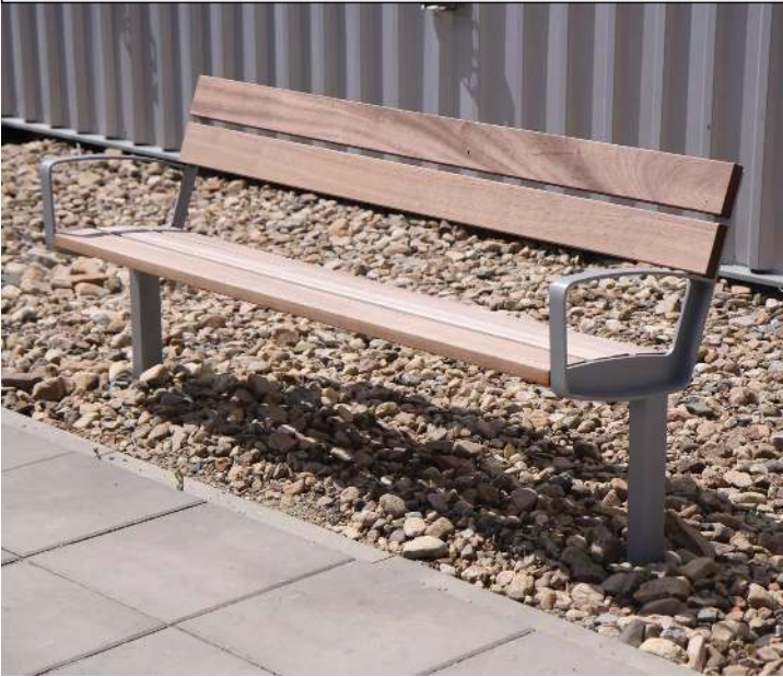
Sitzbank INTERVERA mit Jatobaholzbelattung, Stahlteile in RAL 9007 graualuminium