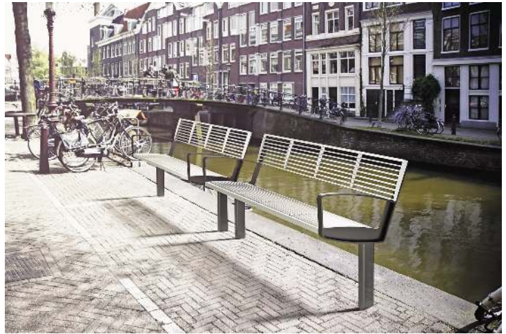
Sitzbank INTERVERA, Auflage Edelstahl, Unterkonstruktion in RAL 7016 anthrazitgrau