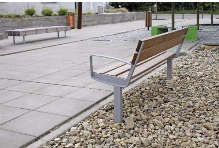
Sitzbank INTERVERA mit Jatobaholzbelattung, Stahlteile in DB 703 eisenglimmer