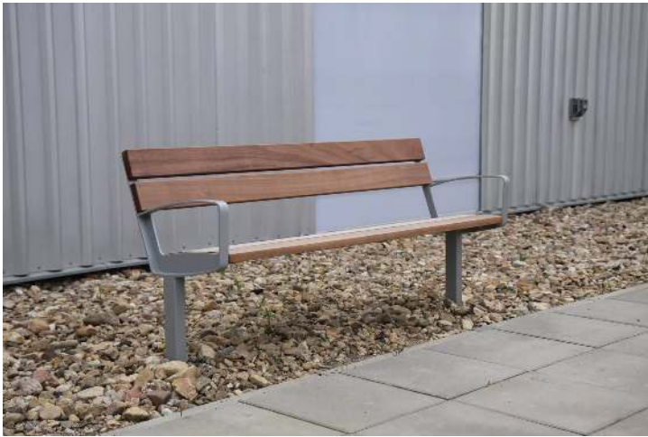
Sitzbank INTERVERA mit Jatobaholzbelattung, Stahlteile in RAL 9007 graualuminium