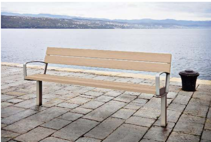
Sitzbank INTERVERA mit Resysta®-Belattung lasiert in pale golden, Stahlteile in 9007 graualuminium