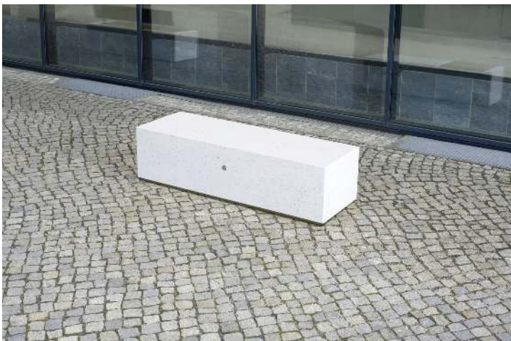
Sitzbank DEMETRA ohne Rückenlehne aus Beton, Sitzflächen gestockt, in Granitoptik weiß<br>