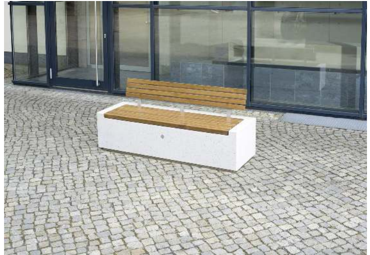
Sitzbank DEMETRA mit Rückenlehne aus Beton gestockt, mit Okouméholzbelattung, in Granitoptik weiß<br>