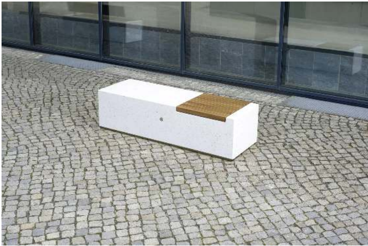
Sitzbank DEMETRA ohne Rückenlehne aus Beton, mit Okouméholzbelattung, in Granitoptik weiß<br>