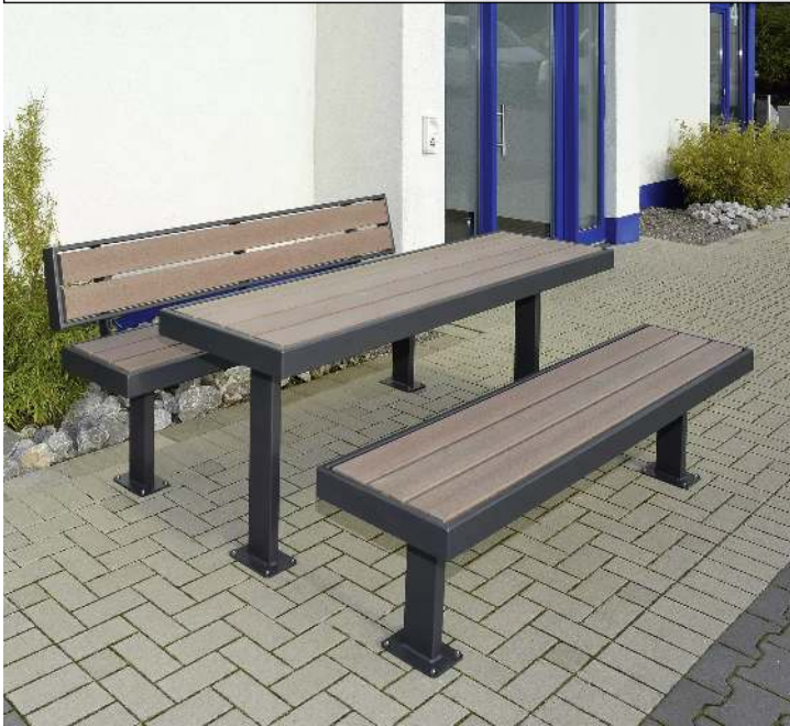
Sitzbänke und Tisch PRASEM, mit WPC-Holzbelattung, Stahlteile in RAL 7016 anthrazitgrau