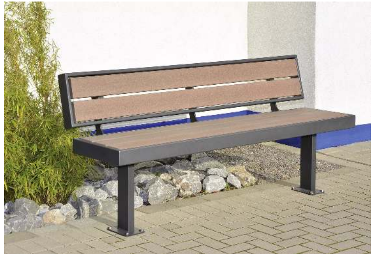
Sitzbank PRASEM mit Rückenlehne, Stahlteile in DB 703 eisenglimmer