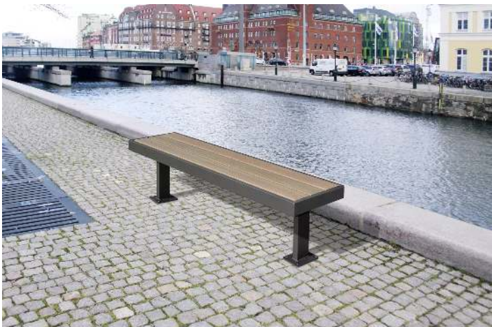
Sitzbank PRASEM ohne Rückenlehne, mit WPC-Holzbelattung, Stahlteile in RAL 7016 anthrazitgrau